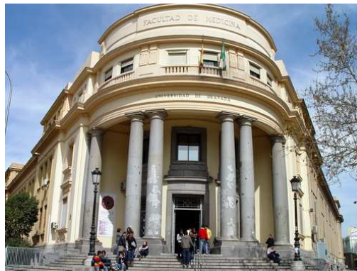
Obr. 3.: Univerzita v Granadě