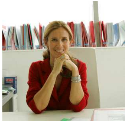
Cristina Garmendia Mendizábal – ministryně Ministerstva pro vědu a inovaci

Nové ministerstvo pro vědu a inovaci, které vede ministryně Cristina Garmendia Mendizábal (narozená v roce 1962 v San Sebastián), by mělo pomoci ekonomice k většímu a především lepšímu růstu a bude zejména podporovat růst nových technologií.