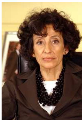
Mercedes Cabrera Calvo-Sotelo - ministryně Ministerstva školství, sociální politiky a sportu

Valencie. Současnou ministriní je Mercedes Cabrera Calvo - Sotelo, která se narodila v roce 1951 v Madridu.